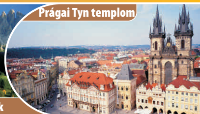
Prágai Tyn templom